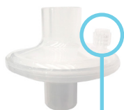
Puerto luer lock